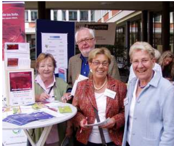
Interkulturelles Fest: Mitglieder der Seniorenvertretung Mit ihrem Stand im Rathausinnenhof