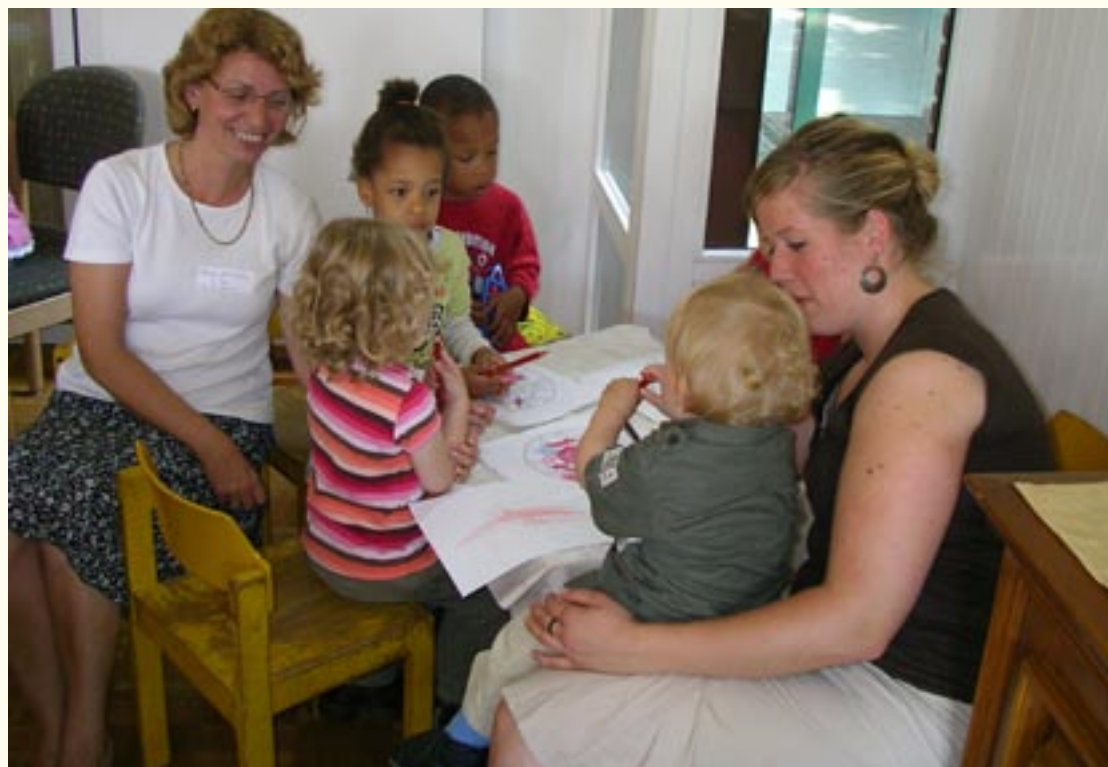
Beim Kennenlerncafé - Maltisch für die Kleinen

Die Seniorenvertretung als Projektträger beantragte finanzielle Unterstützung bei der Stiftung Siverdes und sorgte in jeder Projektphase für eine umfassende Öffentlichkeitsarbeit (Pressearbeit, Informationsstände, persönliche Ansprache von Seniorengruppen etc.). Die Ev. Familienbildungsstätte war maßgeblich an der Konzept- und Faltblattentwicklung beteiligt, moderierte die Kennenlerncafés und sorgte im Rahmen einer Telefonsprechstunde und persönlicher Gespräche für eine möglichst passgenaue Vermittlung von Patenschaften und die Beratung und Begleitung der interessierten und beteiligten Menschen in jeder Projektphase.