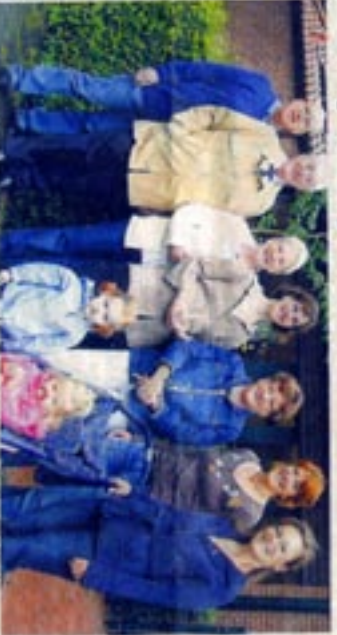
Zu einem Vorberatersitzungen kamen die Projektteilnehmer in Gremmesdorf zusammen.

Projekt „Patengroßeltern“ geht in die zweite Runde