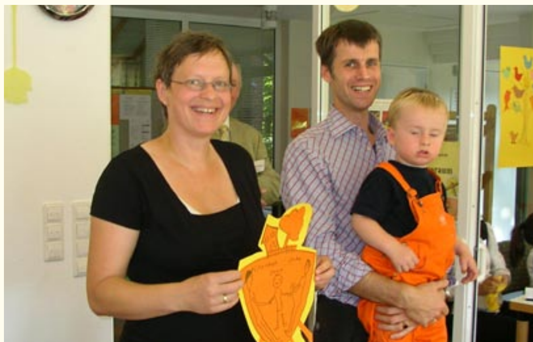
Bei der Vorstellungsrunde im Kennenlerncafé

Alle drei Kennenlerncafés lebten nicht zuletzt auch davon, dass während des Nachmittagverlaufs alle Kooperationspartner als Ansprechpersonen für die Gäste zur Verfügung standen. Da viele kleine Kinder anwesend waren, war es ebenfalls sehr förderlich, dass die Kindergärten jeweils einen Maltisch bereit gestellt hatten und