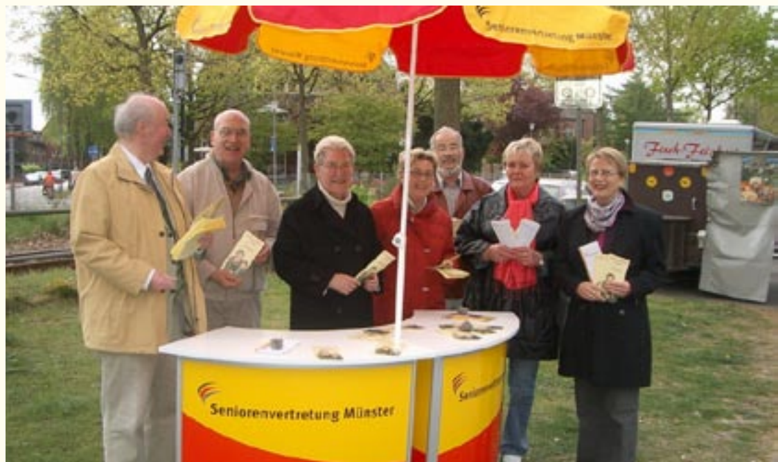
Die Seniorenvertretung macht das Projekt in Gremmendorf bekannt